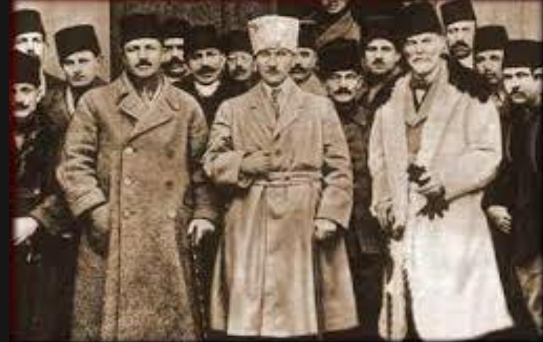
Amasya Protokolünü İmzalayan Heyeti Temsiliye Üyeleri Rauf Bey, Mustafa Kemal Paşa, Bekir Sami Bey